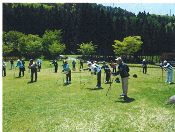
ウォーミングアップ