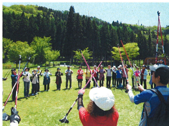
お互いの健闘を称え合い終了

教室お疲れ様でした。良い天気に恵まれ、絶好のウォーキング日和になりました。 展望広場では山形市街を一望。月山・葉山も綺麗でした。 西蔵王公園は蔵王山系の緑豊かな環境に恵まれ、自然志向のレクリエーション需要に応えております。 今年も多くの方々のご来園をお待ちしております。 ご参加いただいたみなさん。ありがとうございました。