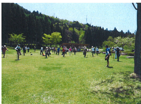
クーリングダウン