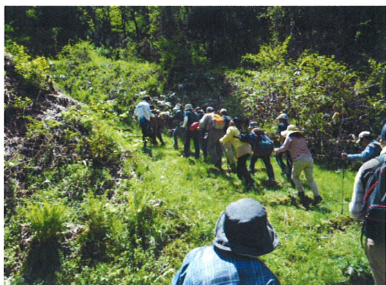
展望広場への急な登り坂